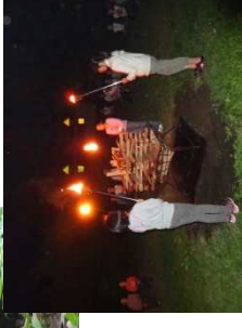
キャンプファイヤーの様子