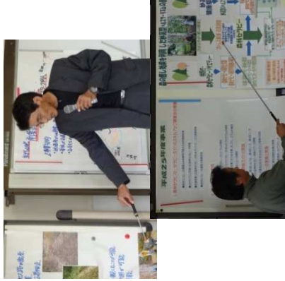
公開審査会でのプレゼンテーション

妙高市地域の元気づくり活動補助金は、妙高市を元気にする活動を自主的に取り組もうとする市内の市民活動団体や地域自治組織へ補助金を交付する制度です。単年度補助する「小さな成功体験事業」と中長期的な活動を複数年度（最大3年間）補助する「地域のやる気事業」があり、公正な審査によって補助金交付の採択が決定されています。 中間発表会では「地域のやる気事業」で交付された8団体が、今年度における現在までの事業進捗状況を発表します。 また、単年度補助金の「小さな成功体験事業」は各団体が、どのような活動をしているのかを知る良い機会です。 ぜひ足をお運びください。