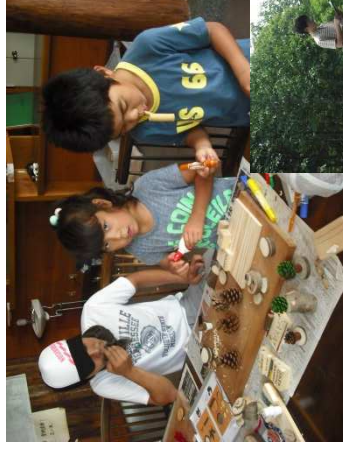
子どもたちも熱心に 取り組んでいます

妙高里山森林公園周辺の再生活動を行う妙高里山保全クラブは「樹木博士検定と工作教室 in 高床山」を8月17日に開催。家族で樹木について学び、森の中で見つけた材料で夏休みの思い出になるオリジナル作品を完成させる体験をしました。参加者の皆さんは、植物のことを学びながらプログラムを楽しみました。