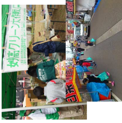
ゴミひろいの様子

当日の運営をお手伝いしてくれるボランティアスタッフを募集しています。 詳しくは…73-7808（妙高市市民活動支援センター）まで。