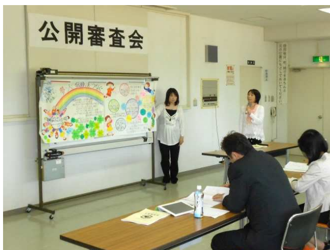
平成24年度妙高市地域の元気づくり活動助成事業公開審査会の様子

妙高市市民活動支援センター(妙高市勤労者研修センター内) 〒944-0046 妙高市上町9-3