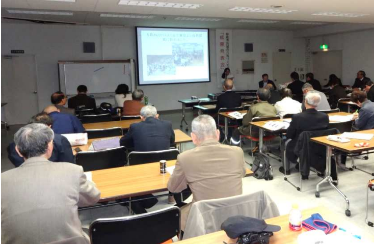
1年間の活動成果を市民の皆さんに発表

3月23日に「地域のやる気事業」の成果発表会を実施し、各団体が平成24年度の事業報告や成果発表を行いました。